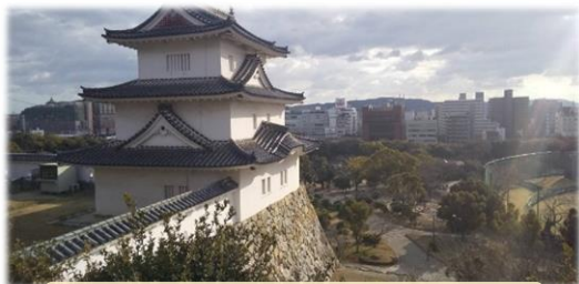
旧明石城天守台より明石海峡方面を眺める

市内の小中学校の先生方と明石近隣のフィールドワークを行い地域素材の掘り起こしとその教材化に取り組んでいます。明石をはじめ有瀬キャンパス周辺には、様々な地域素材が存在します。それらは、教科書には掲載されていないものの、教材として素晴らしい価値をもった素材です。この良さを多くの先生方、子どもたち、そして地域の皆さんに知っていただきたいと思っています。