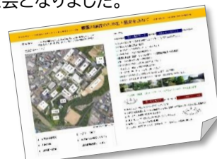
当日配布のレジュメ&情報集↑

参加者からは、朝霧川の上流の様子を初めて知ることができた、グリーンフェスティバル以外では初めて来たがとても面白かったといった声が寄せられるなど、充実した会となりました。