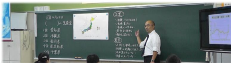
教員の資質・能力の向上について(写真は小学校教員時代の授業風景)

A. 私は、明石市や淡路市で小学校の教員を18年務めていました。その頃から、社会科にこだわりをもって研究してきました。そして、現在も明石